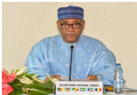
Secretario General de la COBAC

microfinanzas, directores generales y auditores de las instituciones de crédito y microfinanzas de la CEMAC.